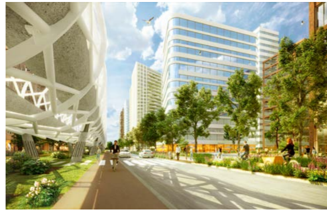
Sfeerbeeld met voorbeeld van meer groen in Prinses Beatrixlaan