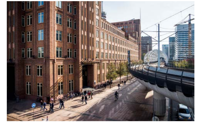
Prinses Beatrixlaan nu met veel steen en weinig groen

Meer weten over wat een toekomstplan is en waarom dit belangrijk is? Bekijk de 'Veelgestelde vragen' op www.denhaag.nl/cid .