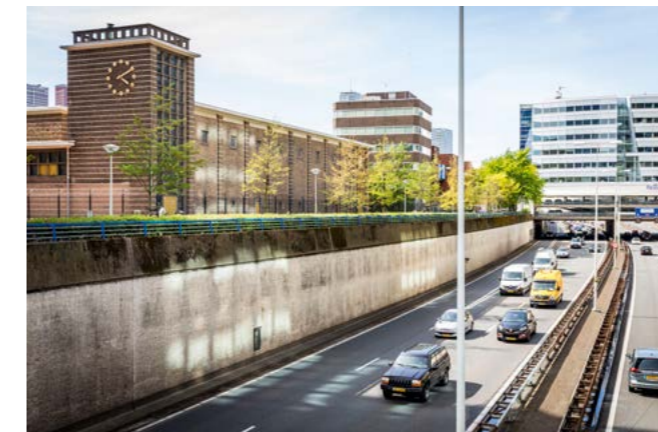
Utrechtsebaan is een obstakel tussen Bezuidenhout en de stad

De gemeente maakt een Toekomstplan Beatrixkwartier en Bezuidenhout-West. Hierin staan afspraken over de toekomst van dat gebied. Bijvoorbeeld hoe de openbare ruimte en gebouwen eruit moet komen te zien. Het toekomstplan bestaat uit 4 onderdelen. Dit jaar werkt de gemeente aan een ontwikkelvisie en een beeldkwaliteitsplan. Daarna wordt een ontwikkelstrategie en een buitenruimteplan gemaakt. In deze plannen staan de voorwaarden waaraan toekomstige projecten moeten voldoen. Het zijn nog geen concrete ontwerpen of bouwplannen. Bij het maken van het toekomstplan vraagt de gemeente advies aan (toekomstige) bewoners, ondernemers, belanghebbenden en gebruikers in en rondom het gebied.