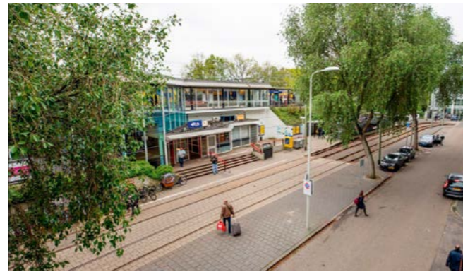
Huidige station Laan van NOI