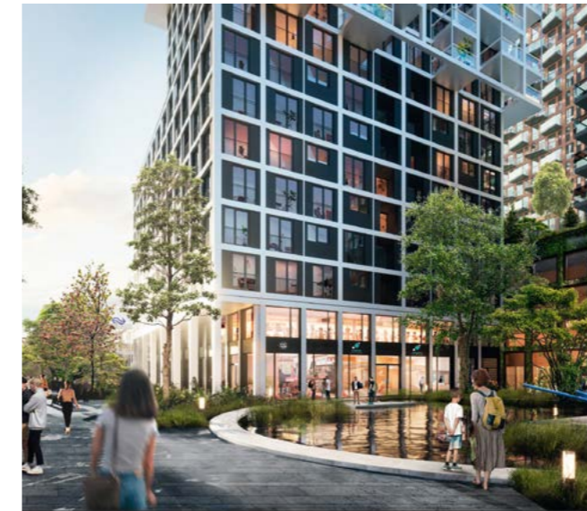
Sfeerbeeld Schenkplein bij nieuwe SoZa gebouwen (Barcode Architects & VORM)

Het station Laan van NOI wordt een volwaardig intercitystation met goede voorzieningen en een aantrekkelijk stationsplein. Om het stationsgebied te kunnen vernieuwen, is de gemeente gestart met een onderzoek, een MIRT-verkenning. Dit doen we samen met ProRail, NS, gemeente Leidschendam-Voorburg, RET, HTM, ministerie van Infrastructuur en Waterstaat en MRDH. In 2024-2026 organiseert de gemeente participatiebijeenkomsten om wensen en ideeën uit de buurt op te halen.